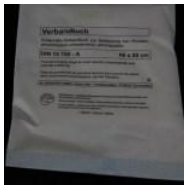
Verbandtuch DIN SO 60 x 80 cm Verbandtuch DIN SO 40 x 80 cm 0,65 €