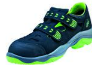
Atlas SL 265 XP green, S1P mit Klettverschluss

Sicherheitsschuh SL 265 XP green, S1P mit Klettverschluss