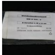
Pflaster-Schnellverband 10 x 6cm Plaster-Schnellverband 10 x 6cm 0,57 €