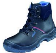
Sicherheitsschuh ANATOMIC Bau Sicherheitsschuh ANATOMIC Bau 500,

Erhältlich in den Größen 41-48 metallische Durchtrittshemmung, Waterproof Glattleder, Überkappe, Outdoor Sohlentechnologie aktiv-X Funktionsfutter, auswechselbare Einlegesohle 3D Dämpfungssystem geeignet für die Einlagenversorgung