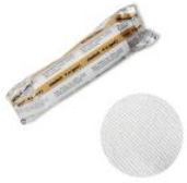
WS-Fixierbinde 4m x 8cm WS-Fixierbinde 4m x 8cm 0,58 €