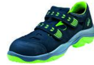
Atlas SL 265 XP green, S1P mit Klettverschluss

Sicherheitsschuh SL 265 XP green, S1P mit Klettverschluss