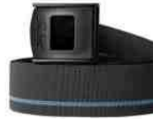
LiteWork - elastischer Gürtel Snickers 9018 LiteWork Gürtel, schwarz

Dieser leichte Gürtel passt ideal zu unseren LiteWork Hosen, Piratenhosen und Shorts. Dünn, elastisch mit einer einfach zu verstellenden Schnalle für optimalen Komfort und Sitz. 40mm breiter, elastischer Gürtel, der sich ideal dem Körper anpasst. Dünnes und leichtes Material für besten Komfort, wenn Sie in der Hitze arbeiten.