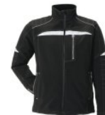
DuraWork Softshelljacke von PLANAM

Die DuraWork Softshelljacke von PLANAM ist ihr sportifer Alltagsbegleiter bei Wind und Wetter. - atmungsaktiv, wasserabweisend und winddicht - 2 seitliche Einschubtaschen mit Reißverschluss - 1 Brusttasche links mit Reißverschluss - Fronstreißverschluss hinterlegt - Bundweitenverstellung mit Kordelzug, - Reflexapplikationen im Brust- Arm und Rückenbereich - Ärmelweite mit Reißverschluss zu regulieren - innen weiches Fleece