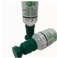
Sterile Augenspülung 200ml Sterile Augenspülung 200ml 6,88 €