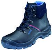
Sicherheitsschuh ANATOMIC Bau Sicherheitsschuh ANATOMIC Bau 500,

Erhältlich in den Größen 41-48 metallische Durchtrittshemmung, Waterproof Glattleder, Überkappe, Outdoor Sohlentechnologie aktiv-X Funktionsfutter, auswechselbare Einlegesohle 3D Dämpfungssystem geeignet für die Einlagenversorgung