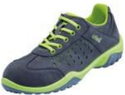
Atlas Damen Sicherheitsschuh GX 135 green, S1P

Damen Sicherheitsschuh GX 135 green, S1P