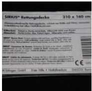
SIRIUS® Rettungsdecke silber-gold 210 x 160 cm SIRIUS® Rettungsdecke silber-gold 210 x 160 cm 1,71 €