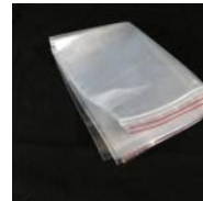
PE-Druckverschlussbeutel 300 x 400 mmx0,05mm PE-Druckverschlussbeutel 300 x 400 mmx0,05mm 0,14 €