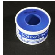
SÖHNGEN® - Plast, Heftpflaster 5m x 2,50cm SÖHNGEN® - Plast, Heftpflaster 5m x 2,50cm 0,56 €